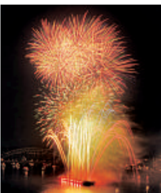
■ Eine bessere Sicht und vor allem mehr Platz soll der Umzug rheinabwärts bringen.

zusammen mit den Sicherheitskräften, die Lichter nicht mehr zwischen Deutzer - und Hohenzollerbrücke, sondern weiter nördlich zwischen Hohenzollern - und Zoobrücke zu zünden. Hier gebe es Platz für alle Zuschauer und wesentlich weniger Sichtbehinderungen durch Häuser oder Bäume auf das Feuerwerk, das in diesem Jahr unter dem Thema „Cinema Colonia“ abgebrannt wird. Infos unter www.koelner-lichter.de „Eintritt frei!“ heißt es am Tanzbrunnen, wo ab 20 Uhr die Höhner für Stimmung sorgen.